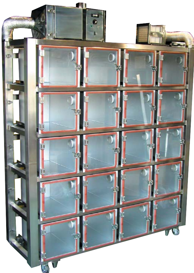
マウス用マイクロバイオクリーンカプセルユニット 4列×5段

室内空気をHEPAフィルターを通して吸気するのでチャンバー内は完璧なクリーン状態に維持出来ます。給気フィルターパック、排気フィルターパックと単独小型なユニットを採用しております。マウス・ラットの感染用、検疫用に最適です。