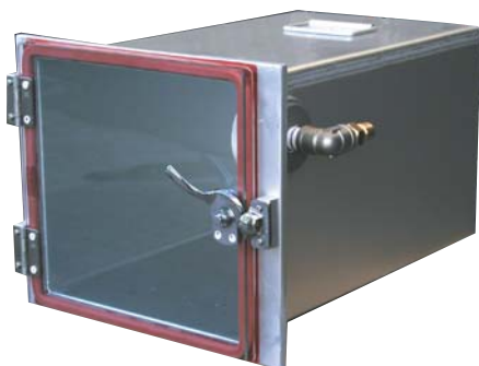
マイクロバイオクリーンカプセルユニット用チャンバー