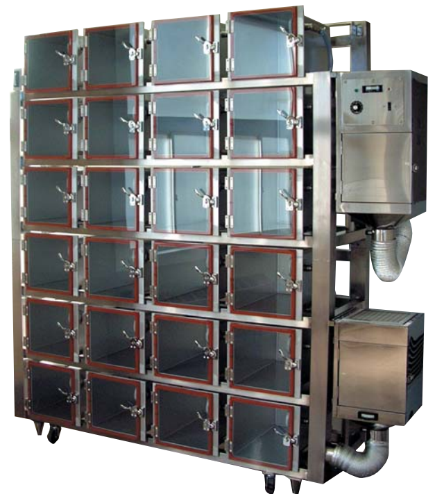
マウス用マイクロバイオクリーンカプセルユニット 給排気フィルターパック ハンガータイプ 4列×6段