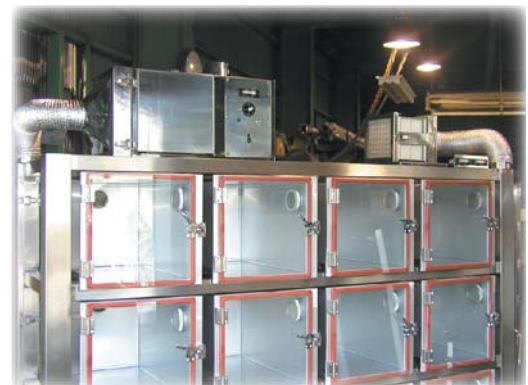
ラック上部 フィルターパック取付け時